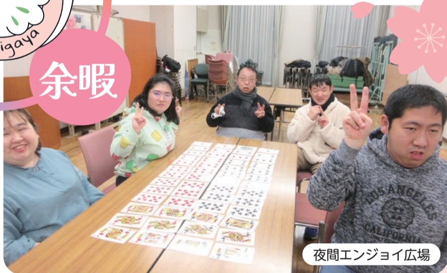
夜間エンジョイ広場