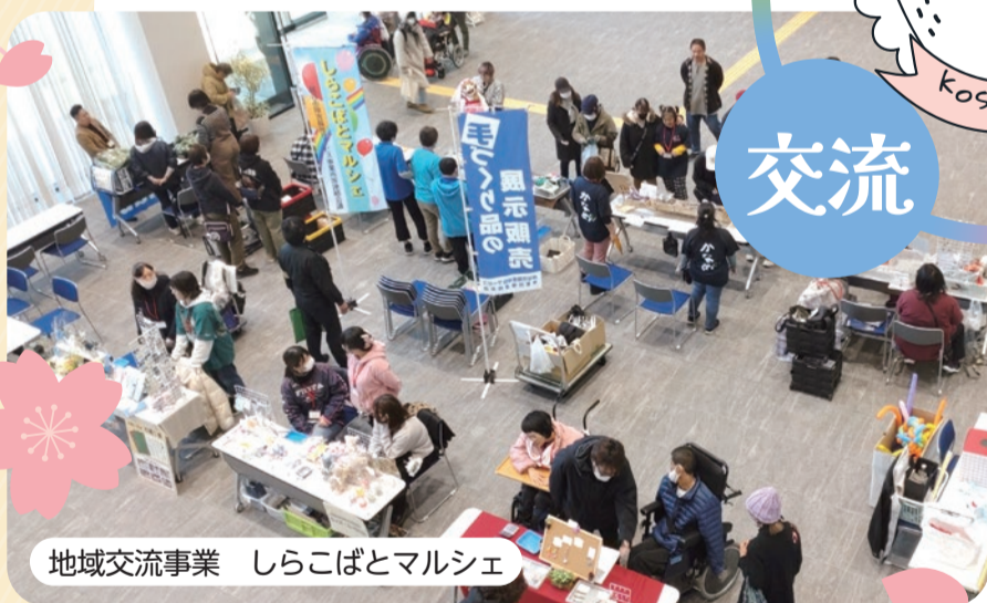
地域交流事業 しらこぼとマルシェ