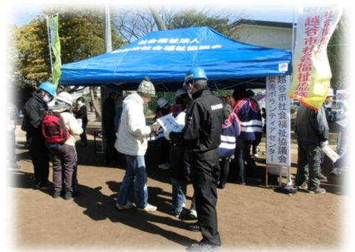
災害ボランティアセンター訓練の様子

本人が直接、越谷市社会福祉協議会地域福祉課へ（電話不可） 申込書等、詳しくは当会ホームページをご覧ください。