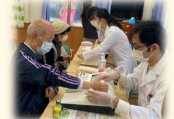
血管年齢測定・骨密度測定 ドキドキ...

参加した皆さんは、体の悩 みや健康への取り組みを専門 職の方に相談することができ、 満足した様子で帰られました。