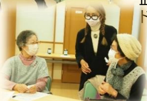
和やかに会話を楽しむ 参加者の皆さん