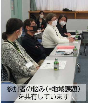
参加者の悩み(=地域課題)を共有しています

その他、荻島地区にはふれあいサロンが充実していることにも触れ、各参加者が関わっているふれあいサロンの取り組みや困り事について共有しました。