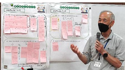
グループごとに発表しました

トを見出せれば参加するの ではないか。」「平日頃か ら若い方へ歩みより、挨拶 や声掛けから始めると良い のではないか。」など前向 きな意見が寄せられました。 また、「若い世代の方は、 実際に自分の住む地域につ いて、どのように考えてい るのかを知りたい。」との