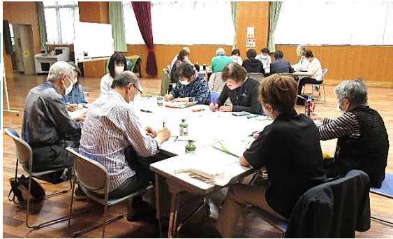
2022.6.9 地域支え合い会議(グループワーク)

南越谷地区地域支え合い 会議では、「世代を問わず 関わり合える取組み」を テーマに話し合いを進めて います。 6月の会議では、若い世 代(15〜64歳)の地域参加 を叶えるためのアイデアを 共有するグループワークを 行いました。