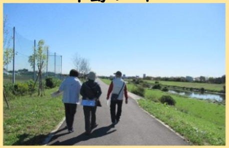
雲一つない青空の下 自然豊かで開放的な川沿いを ゆったりのんびり