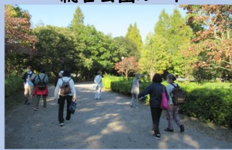
木々が赤く染まりつつある中 絶好のお散歩日和♪