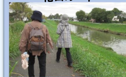
新方川沿いには桜の木が69本! 春は桜の名所に

など、とても好評でした。中には、近くに住んでいても、徒歩で通ったことがなかったという方もいらつしやう、歩くことで、地域の新たな発見にも繋がりました。