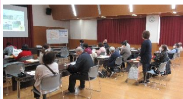
増林の良いところ再発見!