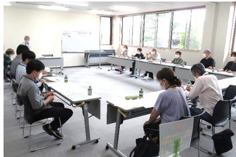
R4.6.23 地域支え合い会議

そこで、高齢者のスマートフォン活用の状況が話し合われ、「スマホを利用しているが通話しかできない方」、「ガラケーしか使用したことのない方」等に対して、スマホで利用可能な機能（LINE・地図・写真撮影等）の活用を促して、自身の生活を支えるツールとなるように支援できたら、という意見が挙がりました。