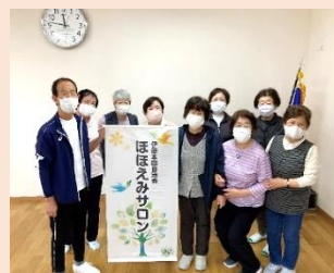
“ほほえみサロン”のリーダーさんたち

令和4年1月、この地域支え合い会議から発信された活動が実を結び、伊原本田自治会館に、介護予防体操のふれあいサロン「ほほえみサロン」が誕生しました。今はまだコロナ禍の影響もありリーダーさんのみの参加となっていますが、少しずつ自治会員にも呼びかけ、参加者を増やしていく予定です。