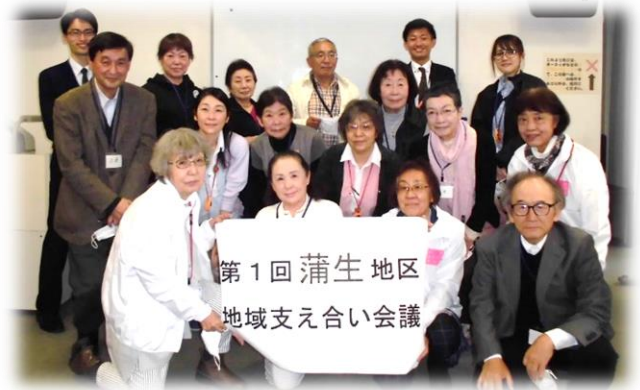
▲第一回会議に参加してくれた皆さん