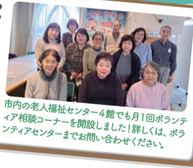
市内の老人福祉センター4館でも1回ボランティア相談コーナーを開設しました!詳しくは、ボランティアセンターまでお問い合わせください。

ボランティアセンターでは、小中学校での車いす体験などを支援していただくボランティアや、災害時に支援していただくボランティア、施設などで演奏や踊りを発表していただくボランティアなど、越谷市ボランティア連絡会や様々なボランティアさん、関係施設と連携しながらボランティア活動をコーディネートしています！ どんな活動があるか気になる!という方は、ぜひ一度ボランティア相談コーナーまたはボランティアセンターへお越しください。