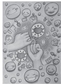
第44回ふれあいの日最優秀作品

内式典、ポスター入賞者表彰式、団体発表、体験コーナー、模擬店、団体活動展示など 主催・第44回ふれあいの日実行委員会 共催・越谷市、越谷市教育委員会、越谷市社会福祉協議会