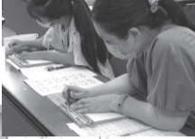
ジュニアボランティアスクールの様子