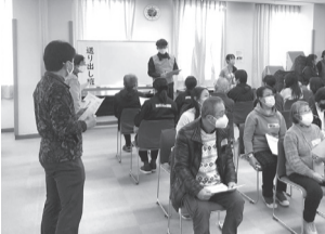
災害ボランティアセンター立ち上げ訓練の様子