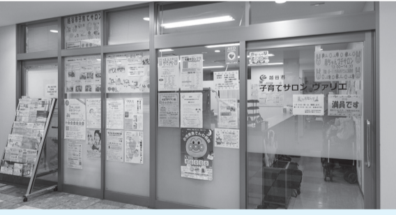
『子育てサロンヴァリエ』 開催日：毎週火曜日～日曜日 午前9時30分～午後5時 会場：新越谷駅ビル ヴァリエ1階 (南越谷1-11-4)

子育てサロンでは、親子で遊びながら、参加者同士の交流や情報交換ができる「子育てひろば」や「赤ちゃんひろば」などを開催しています。参加者が交流しやすいように、年齢別のほかテーマごとに集う子育てひろばも開催しています。働く方や育休中の方、父親、誕生月など毎月いろいろなテーマで開催していますので、ぜひ子育てサロンをご利用ください。