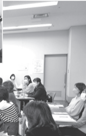
普通救命講習の様子