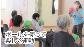
ボールを使って楽しく運動