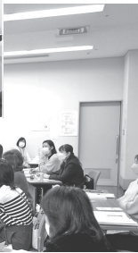
普通救命講習の様子