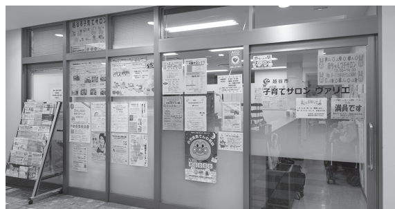
『子育てサロンヴァリエ』 開催日：毎週火曜日～日曜日 午前9時30分～午後5時 会場：新越谷駅ビル ヴァリエ1階 (南越谷1-11-4)

* 子育て講座や対象者限定のひろばもありますので、ご確認のうえ、ご利用ください。