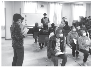
災害ボランティアセンター立ち上げ訓練の様子