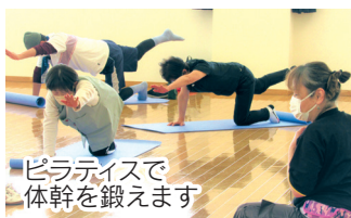
ピラティスで体幹を鍛えます

日 5月27日～7月29日の毎週土曜日(全10回) 時 午前10時～11時 場 多目的ホール 対 市内に住所を有する60歳以上の方 定 25人 内 快適な日常生活を維持するための運動。 ピラティス、ボール運動、ウォーキング、リズム体操、キックボクシングエクササイズ 費 無料 持 上履き、タオル、飲み物 申 5月8日(月)～15日(月)の開館時間内に本人がひのき荘へ(電話申込み可)応募多数の場合は抽選。抽選結果は5月19日(金)午後1時から発表(電話問合せ可)