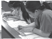
ジュニアボランティアスクールの様子