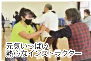
元気いっぱい熱心なインストラクター