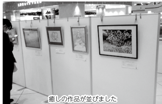
癒しの作品が並びました

市内の文化芸術活動に取り組んでいる障がいのある方やその関係者、特別支援学校児童、生徒のみならずが創作、制作した作品をイオンレイクタウンmori花の広場に展示し、多くの方々に作品を見ていただくことができました。皆様の協力により『こころのアート展』を無事に終えることが出来ました。