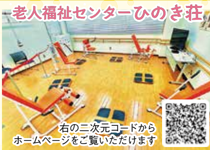
老人福祉センターひのき荘

老人福祉センターは、60歳以上の方を対象に健康増進や教養の向上のための各種講座やレクリエーション活動を提供する越谷市の公共施設で、現在越谷市社会福祉協議会・シンコースポーツグループが共同事業体として指定管理者の指定を受けて運営しています。越谷市内には4か所のセンターが設置されており、年齢を重ねても、健康で明るい生活ができるようサポートするため、講座やイベントの開催、クラブ活動の支援などを行っています。