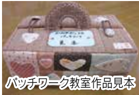
パッチワーク教室作品見本