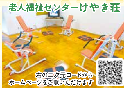
老人福祉センターけやき荘