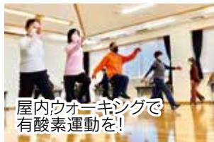
屋内ウォーキングで有酸素運動を!