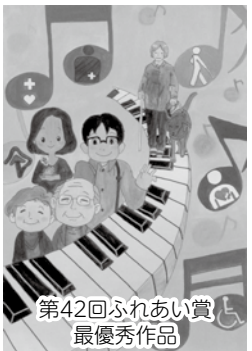
第42回ふれあい賞 最優秀作品

◆登録要約筆記者認定試験◆ 日 2月24日(金) 時 午前9時50分 対 市内在住・在勤で次のいずれかに該当する方 ① 都道府県の登録要約筆記者認定試験等に合格している方 ② 市が実施する要約筆記者養成講習会の受講者 ③ ②と同等以上の技術を有し審査会が認めた方