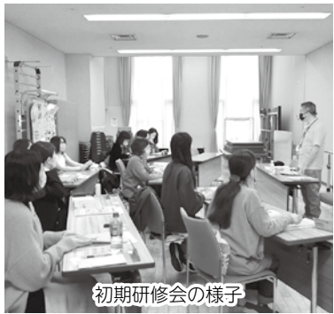
初期研修会の様子