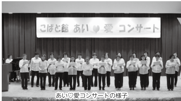
あい♡愛コンサートの様子

障害者福祉センター こぼと館 〒343-0813 越ヶ谷4-1-1 (966)6633 FAX (966)5515