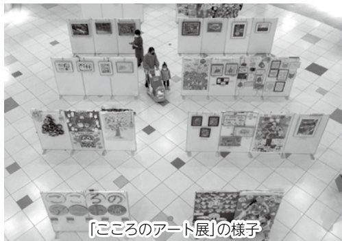
「こころのアート展」の様子